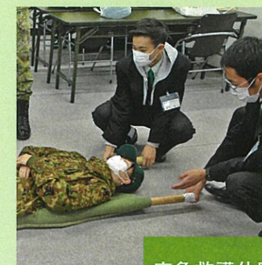
② 11:10~ 応急救護体験