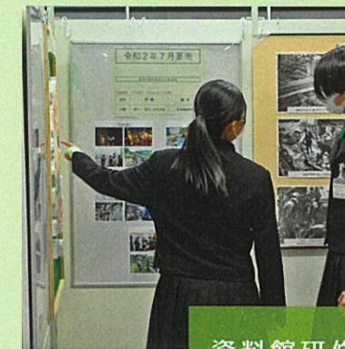
④ 12:40~ 資料館研修