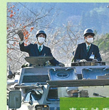
⑥ 13:55~ 車両試乗