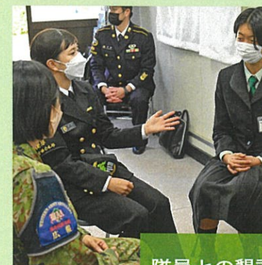
⑦ 14:30~ 隊員との懇談