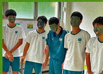
カモフラージュメイク