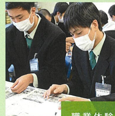
⑤ 13:10~ 職業体験