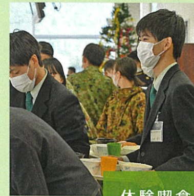
③ 11:40~ 体験喫食