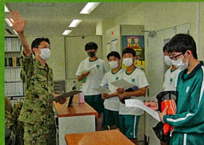
デスクワーク研修