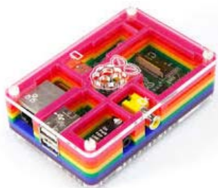
・ラズベリーパイ