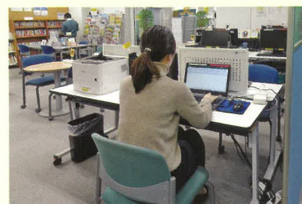
書類作成コーナー