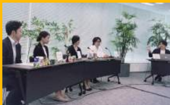
7月に開催された七夕編の様子。食に関わる25社が参加。人事の素顔を感じるパネルトークも実施。