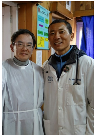
2010年から共同で内視鏡検査