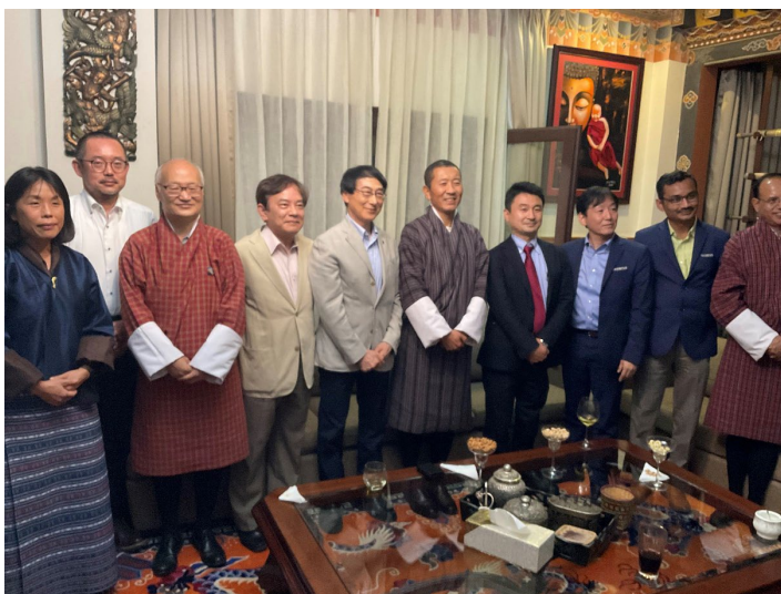
保健省大臣自宅にて 首相も食事会に参加