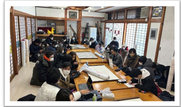
昨年の事業の様子