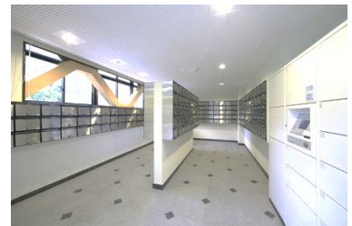
メール・宅配ボックス