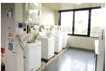
コインランドリー