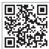
申込みフォーム QRコード